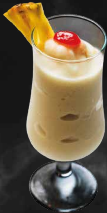
Cóctel Piña Colada