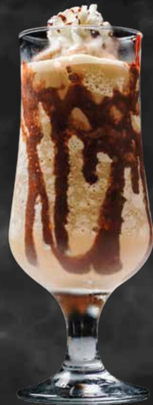
Cóctel Frozen Cappuccino