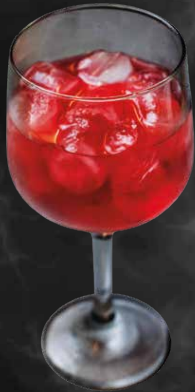
Cóctel Fantasy Tonic (Cin tonic con Red Bull Waterlemon)