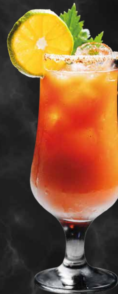
Cóctel Bloody Mary (natural o picante)