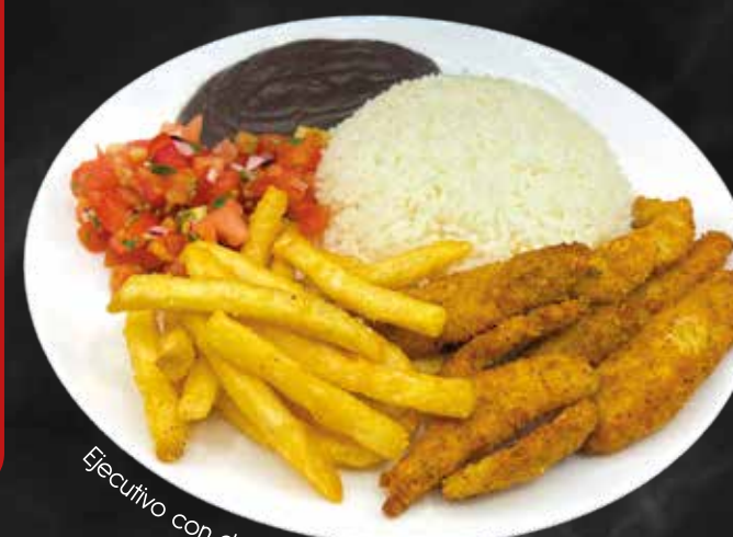
Ejecutivo con dedos de pescado