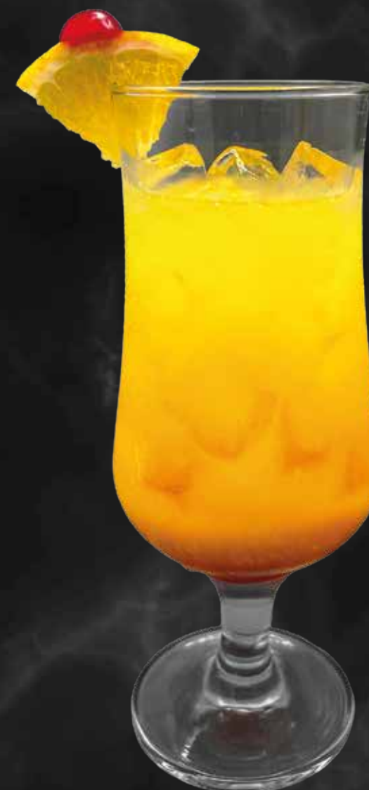
Cóctel Tequila Sunrise