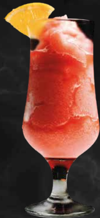
Cóctel Daiquirí Fresa