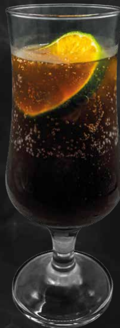
Cóctel Cuba Libre De La Casa