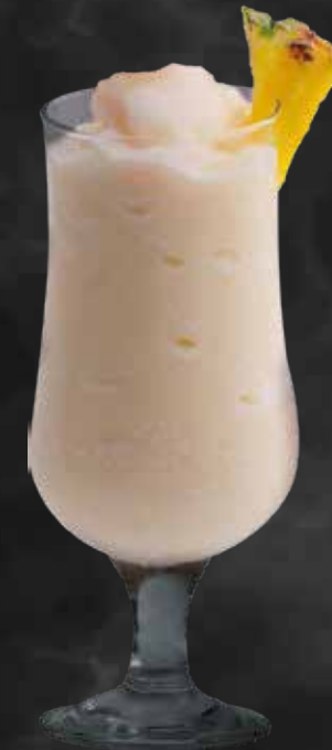
Smoothie Piña Colada